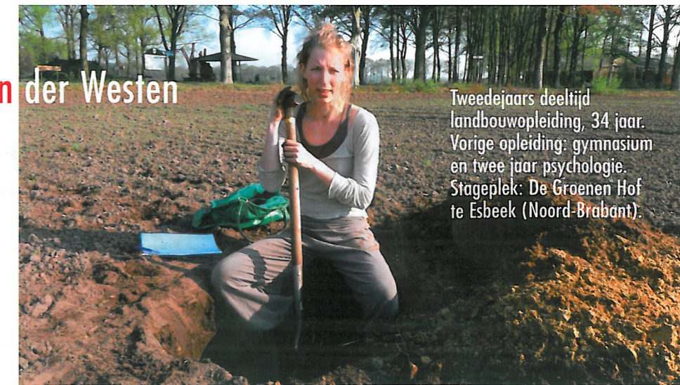
Tweedejaars deeltijd landbouwopleiding, 34 jaar. Vorige opleiding: gymnasium en twee jaar psychologie. Stageplek: De Groenen Hof te Esbeek (Noord-Brabant).