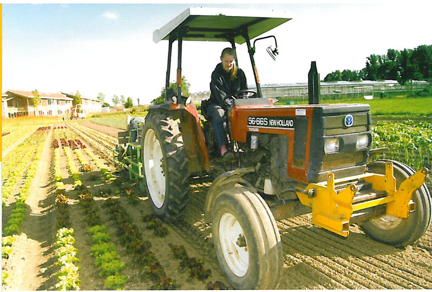
Sla planten tijdens de middagpraktijk